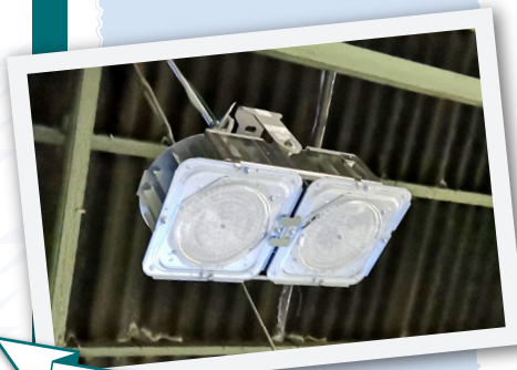
工場内照明のLED化工事

富士市内某工場様のご依頼で、照明のLED化工事を行いました。以前は、同じく省エネの無電極照明(1000W相当)を取り付けており、通常LEDは400Wを起用することが多いのですが、今回「三菱高天井用ベースライト/メタルハライド1000W(EL-GT40112N/W)」のLED照明器具を採用し、以前よりも明るくなりました！